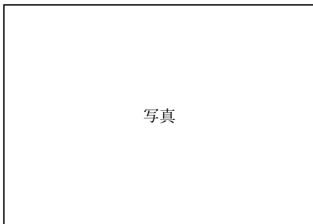
教室でのテント作り。まるで、秘密基地をつくっているようでした。

お世話いただきました父親委員の皆さま、保護者の皆さま、本当にありがとうございました。